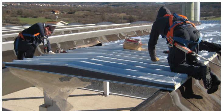
Techtum™ si distingue per la sua facilità e rapidità di posa. Techtum™ stands out for its ease and quick laying.